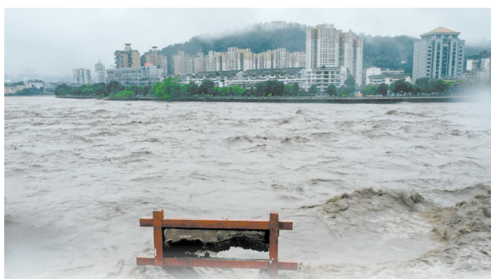
青衣江雅安段洪水汹涌

8月18日6时,四川省水利厅向大渡河流域水电开发有限公司发出调度令,要求该公司控制瀑布沟出库流量,并提前通知工程上下游受影响的地方政府和相关部门。(本报综合)