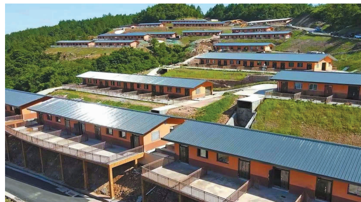
南江黄羊笔架山一级扩繁场。