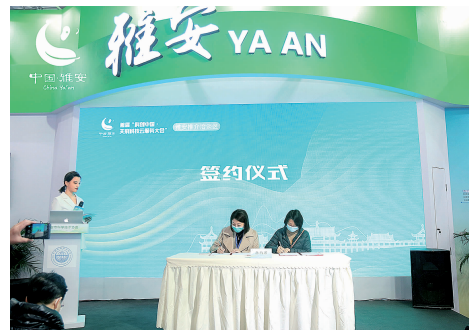
雅安推介洽谈区现场签约仪式