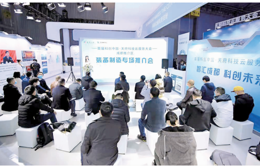
成都推介洽谈区现场

“科创会”上，成都推介洽谈区围绕主导产业举办了电子信息、装备制造、生物医药、航空航天（新材料）和乡村振兴5个类别的专场推介会，对成都科技工作者（团队）、高校、科研院所、企事业单位等在“天府科技云”平台发布的多个科创项目进行集中展示和推介，促成一批科技项目、科研项目、科技难题等科创供需有效对接。