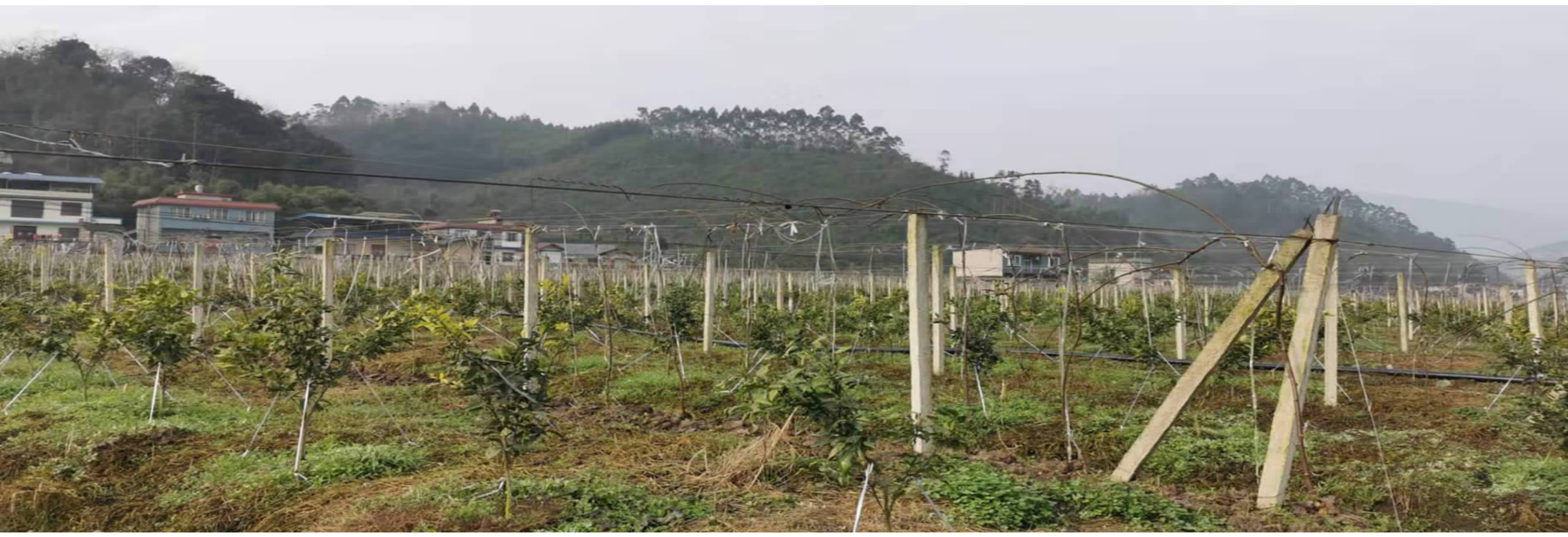
红心源农业示范基地