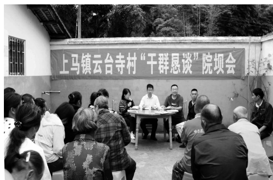
上马镇云台寺村召开“干群恳谈”院坝会