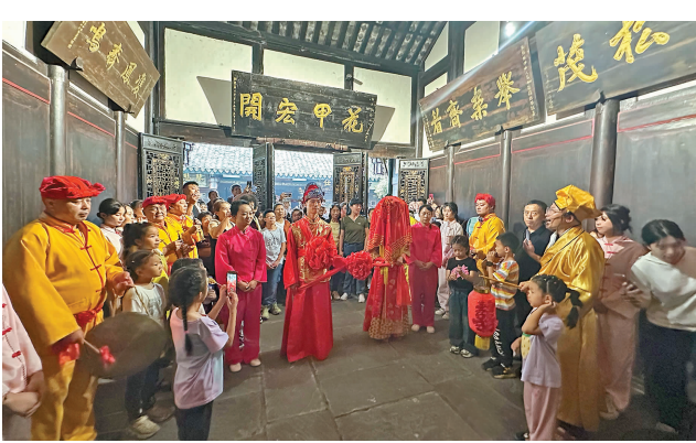
游客们正在欣赏民俗表演。

参观完夕佳山民居,探班员真切地感悟到蕴藏其中的匠心之美,深切地感受到中国古建筑独具特色的神韵和风采。如果你也对中国古建筑感兴趣,一定要来亲自参观体验,相信定会不虚此行。