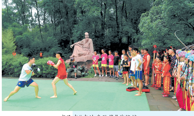
市民在“东坡盘陀像”前锻炼