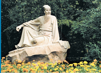
三苏祠内“东坡盘陀像”