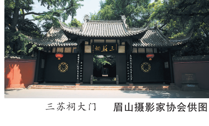
三苏祠大门