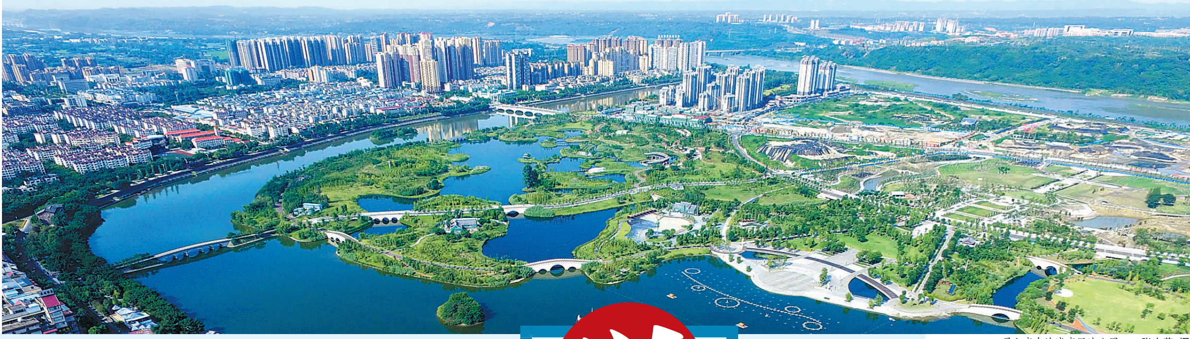
眉山市东坡城市湿地公园

是什么样的人,可以把别人的苟且活成自己的潇洒;是什么样的人,可以将自己的贬谪之路走得开满鲜花;是什么样的人,可以把自己凝结成文化,洒遍神州土地;又是什么样的人,穿越古今,成为“千年英雄”影响世界,光辉璀璨? 这个人就是苏东坡。