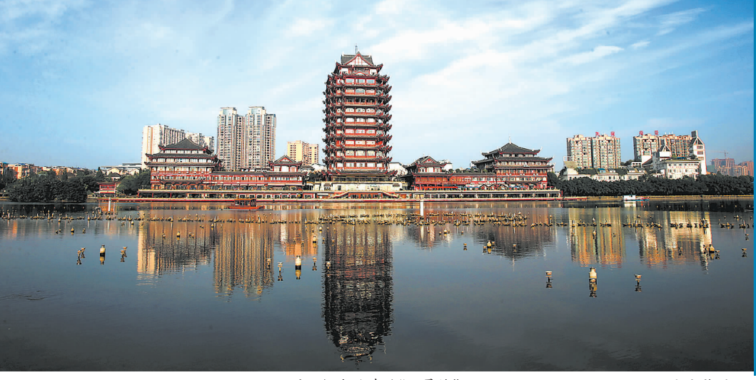
眉山标志性建筑“远景楼”

眉山,对苏东坡而言,是人生的始发站,是品学与性情的养成地;而苏东坡之于眉山,绝不仅仅是那散文诗词、书法名著,也不仅仅在于“三苏祠”等苏迹。“孕奇蓄秀当此地,郁然千载诗书城”,南宋诗人陆游一语中的,把苏东坡带给眉山的历史文化自信表露无遗。