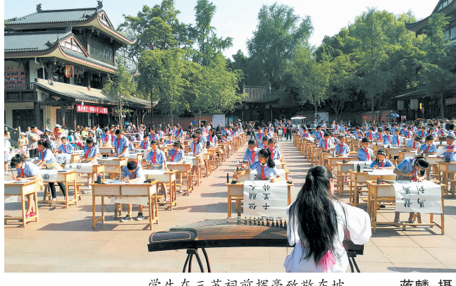
学生在三苏祠前挥毫致敬东坡