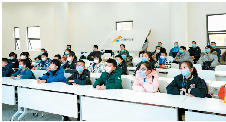
小朋友们认真聆听机器人基础知识讲解

初识机器人的魅力后，小记者们按捺不住，纷纷开始动手尝试制作“机器人”。“机械臂因其独特的操作灵活性，在工业装配、安全防爆等领域得到了广泛的应用。”在老师的讲解下，小记者们了解了机械臂的简易构建模型和液压原理，利用小木条、注射器、塑胶管、橡皮筋、螺