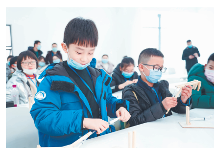
制作手工液压“机械臂”