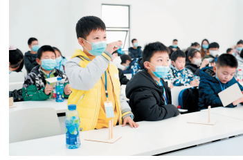
小朋友积极回答讲解员的提问

前，小记者们发出阵阵惊叹。在基地展示中心，1:1大小的“玉兔号”月球车模型、农业植保无人机、超能水机、武装打击机器人、调酒机器人早已“等候”多时，它们造型各异、功能先进，散发着浓浓的科技“气息”。