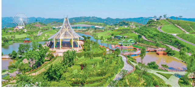
犍为·世界茉莉博览园田园综合体。