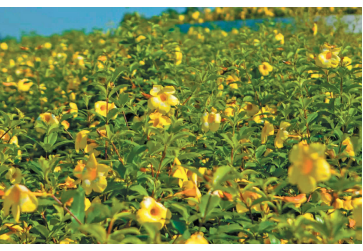
园内的法国香水茉莉。