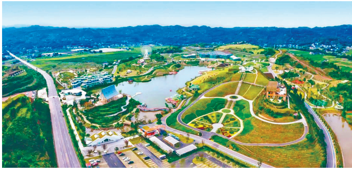
犍为·世界茉莉博览园。

在乐山市犍为县岷江中下游,有一个名为“清溪”的小镇,是“中国茉莉之乡”的核心区域,因茉莉花产业而远近闻名。这里,不仅深度挖掘与保护传承茉莉花文化,还以其独特的“花、产、旅”融合发展模式助推乡村振兴。