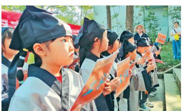
研学活动中,学生诵读《三字经》。