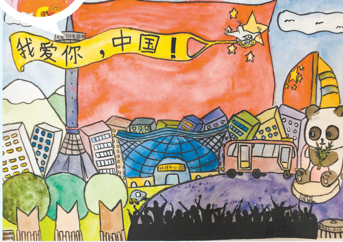
(该作品获“我看祖国的发展”征稿活动二等奖)