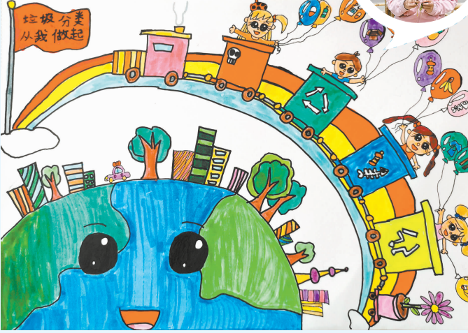
(该作品获“我看祖国的发展”征稿活动二等奖)