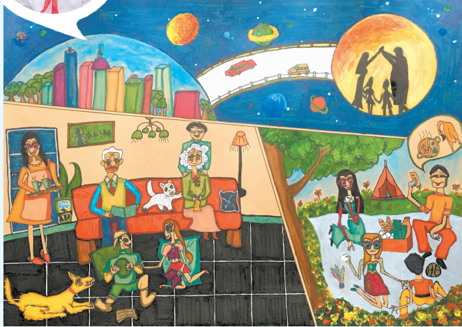
(该作品获“我看祖国的发展”征稿活动一等奖)