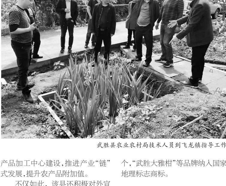
武胜县农业农村局技术人员到飞龙镇指导工作

该县围绕四川省现代农业“10+3”产业体系,确立了武胜县“2+3”产业体系(即:粮油、生猪2个基础产业,武胜大雅柑、蚕桑、水产3个特色产业),现已建成优质粮油基地10万亩、武胜大雅柑基地20万亩、优质蚕桑基地3万亩、稻渔综合种养基地2万亩,年出栏生猪100万头左右,建成省级现代农业园区1个、市级园区3个;同时该县注重延链、强链、补链,做深做精做强农产品加工业,以国有大型初加工冷链物流交易中心建设为引领,加快农