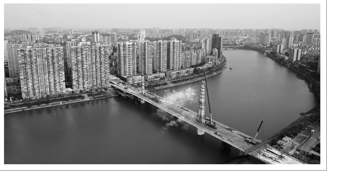
麻柳坝大桥主塔封顶

8月30日,内江市麻柳坝大桥主塔顺利封顶,为大桥贯通按下了“快捷键”。麻柳坝大桥位于内江主城区,是连接东兴区和市中区的重要交通枢纽,全线双向六车道,全长572米、宽33.5米,主桥采用主跨155米高低塔斜拉桥。大桥建成通车后,对于完善城市区域路网、过江通道布局、城市空间拓展以及居民交通出行具有重要意义。