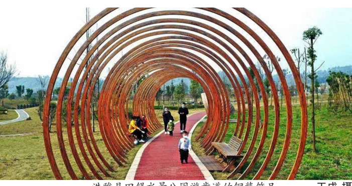
洪雅县田锡水景公园游步道竹钢装饰品