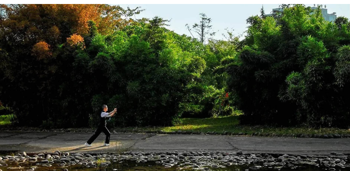
老者在洪雅县生态广场打太极