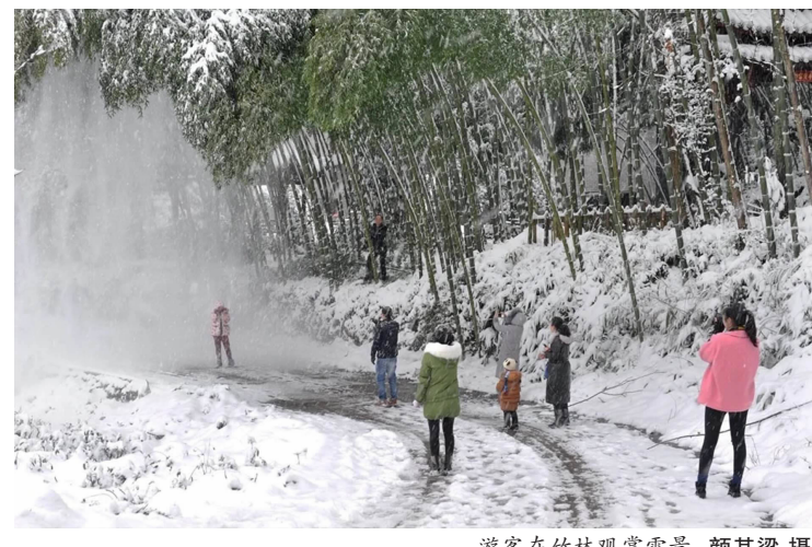
游客在竹林观赏雪景