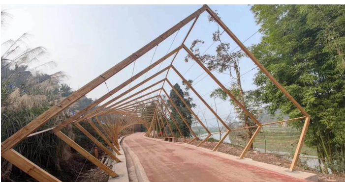
稻香湾梦幻田园内的竹钢装饰品

其中,洪雅县柳江镇洪江村幅员面积达3.12万亩,林竹覆盖率达90%,为洪雅县乡村振兴先行村、村集体经济发展试点村。2018年,洪江村完成了乡村振兴总体规划,落地地流转项目,确定产业发展模式,并依托县“百名人才联乡村”活动,在竹产业发展上做文章,大力实施地产业改造及高山苦竹培育,建设竹文化民宿、竹文化营地,并积极开展竹文化节活动。村民们依靠竹材销售、竹笋销售和乡村旅游产业等三项收入,实现了增收致富。