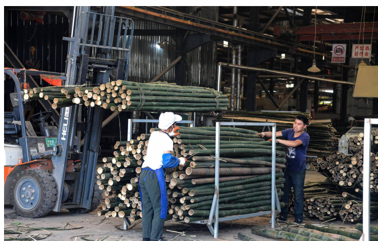
工人正在整理竹钢原材料——茨竹