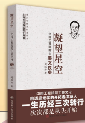
凝望星空——中国工程院院士姜文汉传

两院院士是国家设立的最高学术称号,也是我国科技人才队伍的杰出代表。两院院士是国家的财富、人民的骄傲、民族的光荣,他们为祖国和人民作出了彪炳史册的重大贡献。