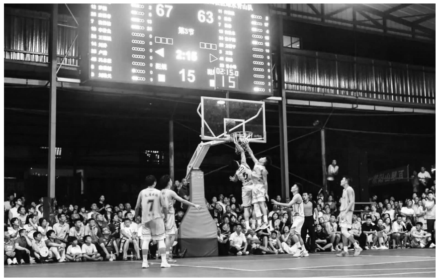
决赛现场,球员们全力以赴。周宇琴 摄

本报讯 青春、汗水、热情、拼搏……这个“奥运季”的夏天,眉山市洪雅县被火热的篮球运动点燃。8月6日,历经19天激烈角逐的四川省“百城千乡万村·社区”篮球比赛暨2024年洪雅县“瓦屋山杯”乡村篮球联赛在瓦屋山镇圆满落幕。此次联赛共有10支球队参加,最终桌山社区绿水青山队以94:83的比分战胜坪坪村雅连队,获得冠军。