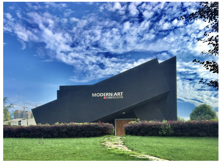
许燎源当代艺术馆