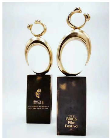
许燎源设计的2017年金砖国家电影节熊猫奖奖杯

走进展厅，精美的艺术作品令人目不暇接，有造型独特的椅子和沙发、抽象主义线条的艺术画、各