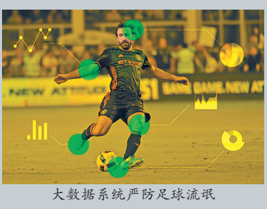
大数据系统严防足球流氓

大数据系统 助球场严防足球流氓 2016年欧洲杯期间,俄足球流氓“一战成名”,也使得球场安保成了俄罗斯世界杯的重中之重。为缩短球迷入场时核验证件的时间,准确阻拦有前科的足球流氓,俄罗斯世界杯球场采用了俄国家原子能集团公司研制的大数据入场系统。该系统能够快速识别球票、球迷ID、媒体证等9类证件,通过专门的信息传输通道,系统可在短时间内储存和处理数