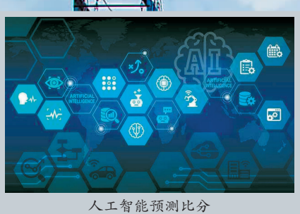
人工智能预测比分

6月14日,第21届世界杯在莫斯科卢日尼基体育场开幕。作为传统科技强国,俄罗斯的球场上自然也少不了科技元素。伴随开场哨声,一起盘点下本届世界杯上的“黑科技”。