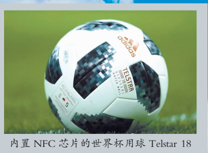
内置 NFC 芯片的世界杯用球 Telstar 18