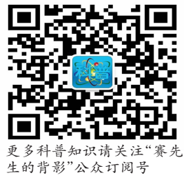
更多科普知识请关注“赛先生的背影”公众订阅号

此时,家长需要及时观察孩子的情绪变化,尤其是识别他们的负面情绪,了解孩子对成绩的预期。无论结果如何,都应该保持与孩子的沟通,倾听他们的真实想法,加强陪伴,和孩子一起,共同思考和规划未来,支持他们的选择。一旦发现孩子有严重的消极想法,必要时还可以寻求老师、专业心理医生的帮助。(朱香)