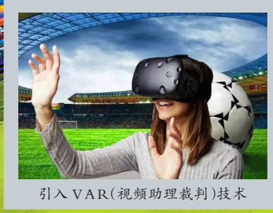
引入 VAR(视频助理裁判)技术

大数据系统 助球场严防足球流氓 2016年欧洲杯期间,俄足球流氓“一战成名”,也使得球场安保成了俄罗斯世界杯的重中之重。为缩短球迷入场时核验证件的时间,准确阻拦有前科的足球流氓,俄罗斯世界杯球场采用了俄国家原子能集团公司研制的大数据入场系统。该系统能够快速识别球票、球迷ID、媒体证等9类证件,通过专门的信息传输通道,系统可在短时间内储存和处理数