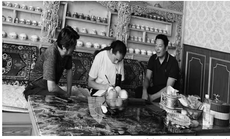
网格员走进群众家中开展民生服务

自市域社会治理现代化试点工作开展以来,乡城县坚持共建共治共享工作理念,高质量推进市域社会治理现代化,积极打造“网格化服务管理+网格群众微信群”社会治理模式,建立“政法吹号、网格站哨、部门报到”社会治理体制,达成“多网融合,一网通办”、“村情动态一网知、群众需求事件网中办”总目标,累计解决群众诉求1270条,真正实现群众办事“最