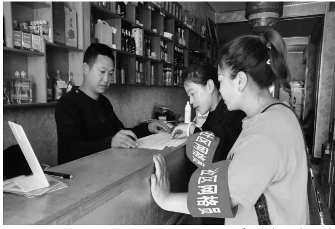
网格员积极解决群众诉求

在具体组织实施上,该县还组建了县、乡、村(社)三级网格,把全部社会管理资源纳入网格,群众则通过网