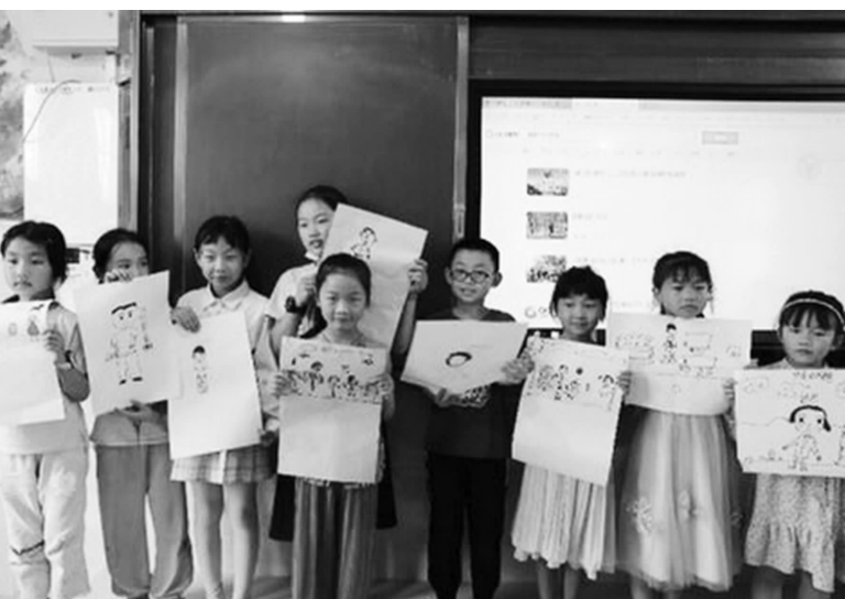
孩童展示绘画作品

为有效激活辖区队伍和阵地资源，推动新时代文明实践走深走实，永兴村积极盘活现有公共服务资源，将该村党群服务中心、文化活动中心、心理服务站等面向辖区居民开放的服务场所全部纳入文明实践阵地建设，构建了理论宣讲、教育培训、文化服务、邻里帮扶、健康促进与体育服务等五大平台，推动实现新时代文明实践空间阵地矩阵化，并结合新时代文明实践阵地空间布局，坚持以居民需求为导向，借助紧邻天星小学地理优势，打造了阳光