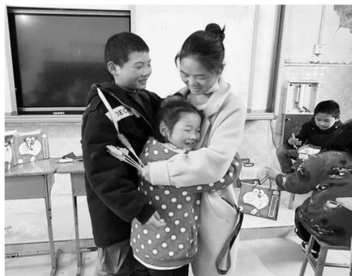
开展暖心志愿服务活动

近日，在南充市嘉陵区大通镇永兴村新时代文明实践站里，老人和孩子们笑声不断，区民政局工作人员组织20余组爱心家庭，为该村的独居老人、困境家庭和留守儿童送上油、牛奶、文具等各种礼物，大家脸上都洋溢着幸福的笑容。