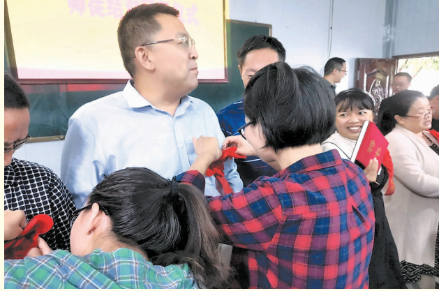
青年教师为指导教师戴花

据悉，今年 9 月以来，该镇已先后开展送法进校园活动 3 场，宣讲主题涉及拒绝毒品、反对校园欺凌、反对校园暴力、预防未成年人犯罪、培养法治意识等多个方面。（胡智 杨勇 本报记者 张跃明）