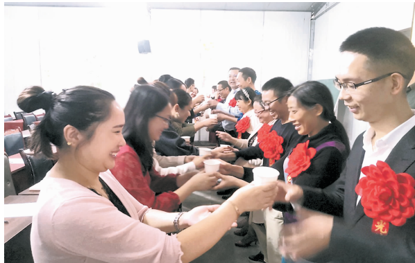
青年教师向指导教师敬茶